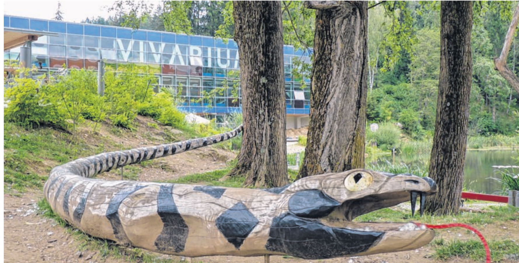
Kein Leben im Vivarium: Die ehemalige Tourismuseinrichtung in Mariahof steht nach wie vor leer