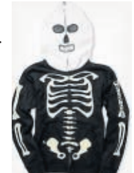
Der auffällige Kapuzensweater der Täter

Nach dem Überfall auf einen 17-jährigen am Parkplatz des Furtnersteichs am Mittwoch (wir berichteten), sucht die Polizei nun nach zwei 20 bis 25 Jahre alten Tätern. Sie sprechen Deutsch mit ausländischem Akzent und waren beide mit einem auffälligen Kapuzensweater mit Maske bekleidet (siehe Foto). Die Polizeiinspektion Neumarkt bittet um Hinweise unter der Telefonnummer 0 59 133-6361.