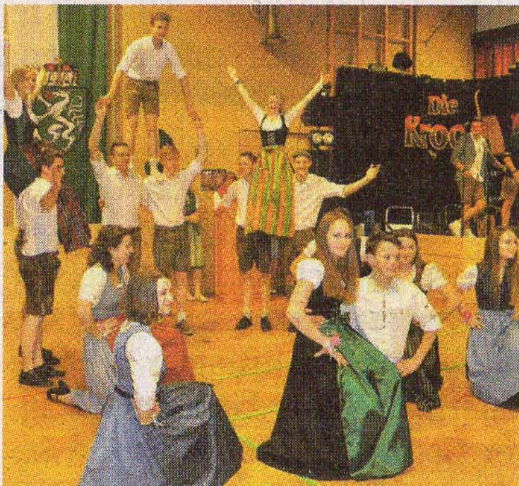
Die Landjugend zeigte eine tolle Polonaise.